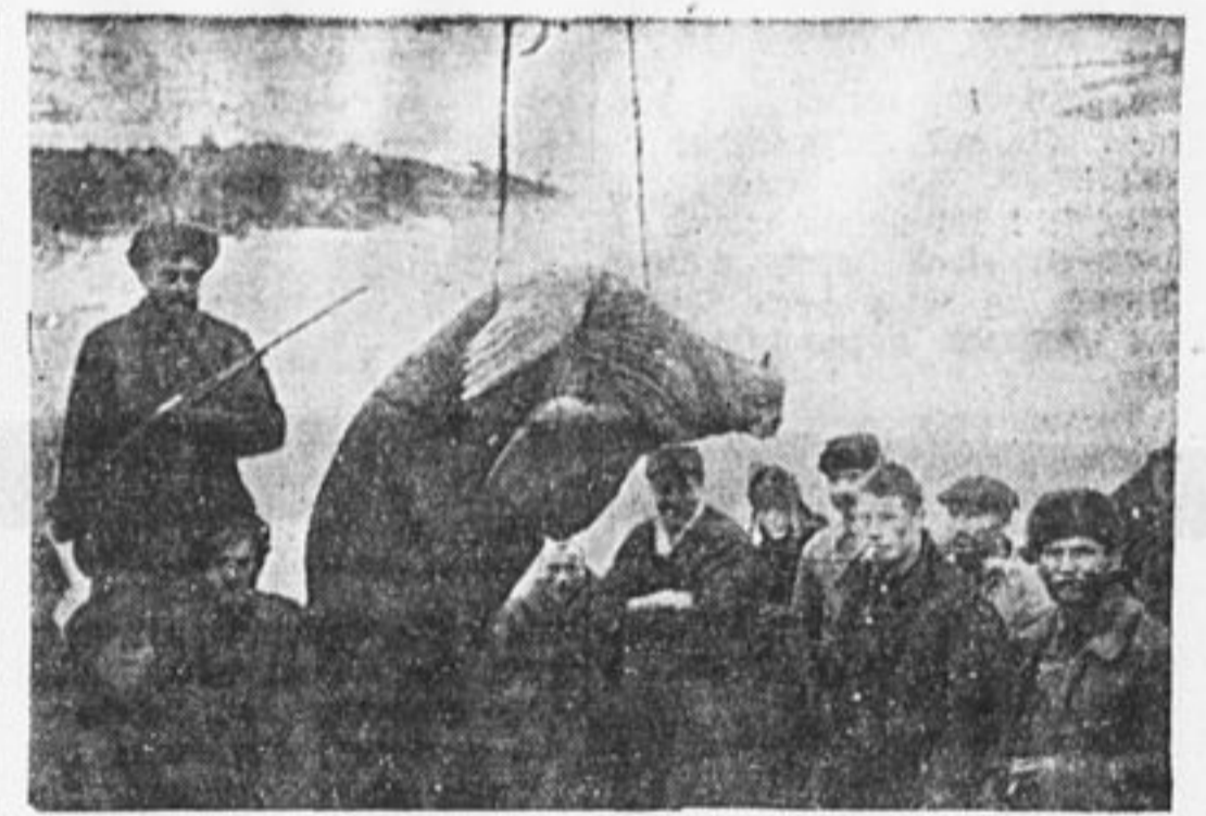
Погрузка огромного морна; убитого русскими охотниками на берегах Северного Ледовитого океана;

куры начинают раньше нестись и никогда не бывает яиц без скорлупы. Носка яиц без скорлупы привлекает птицу и дурной привычке — склевывать свои яйца, сначала они это делают с яйцами без скорлупы, а затем и склевывают яйца со скорлупой. Эта дурная привычка тем более нежелательна, что она передается и другим курам во дворе; отучить от нее нельзя и приходится резать такую птицу. М. Зарина.