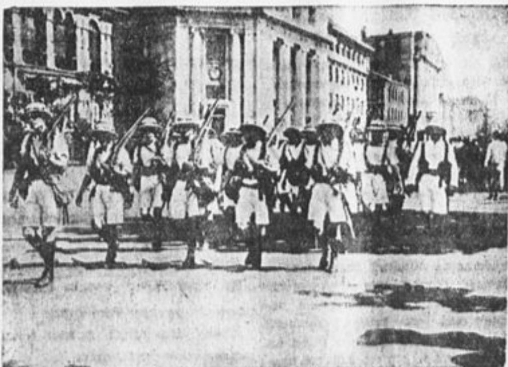
Английские войска в гор. Ханькоу