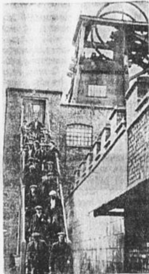
Горняки Юж. Уэльса (Англия) спускаются в шахтерской вышки.

Приводим список 30 городов СССР с населением свыше 100 т.: Москва — 2.018.286 чел., Ленинград — 1.611.103 чел., Киев — 491.333 чел., Баку с приокм. район. — 443.333 чел., Одесса — 411.111 чел., Харьков — 407.578 чел., Ростов-на-Дону с Нахичеванью — 302.416 чел., Ташкент — 294.349 чел., Тифлис — 275.915 ч., Саратов — 211.756 чел., Днепропетровск — 187.644 чел., Нижний-Новгород с Канавиним — 180.926 чел., Казань — 174.732 чел., Самара — 174.509 чел., Краснодар — 161.498 чел., Астрахань — 152.543 чел., Тула — 148.879 чел., Сталинград — 142.254 чел., Свердловск с Верхне-Исетским заводом — 130.265 чел., Минск — 123.613 чел., Оренбург — 121.324 чел., Новосибирск — 119.977 чел., Пермь с Мотовилихой — 119.404 чел., Воронеж — 115.477 чел., Омск (без Ново-Омска и Ленинска) — 113.831 чел., Ярославль — 112.046 чел., Иваново-Вознесенск — 110.652 ч., Тверь — 105.714 ч., Владивосток — 102.207 чел., Самарканд — 100.182 чел.