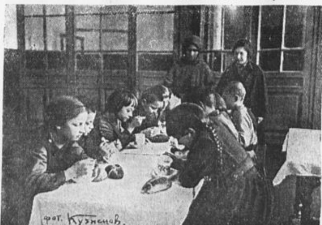
Ученики 12-й школы, 1-й ступени г. Сратова, застраивают.