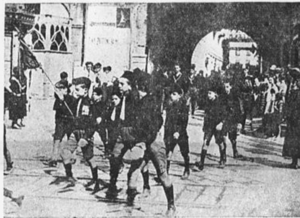
Демонстрация маленьких фашистов в Италии. Знаменосец носит орден своего умершего отца фашиста.