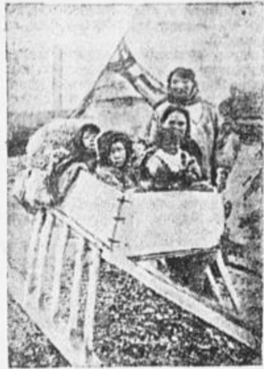
Семья землероек. На санях устроены ящики в котором перевозятся дети.

Во время наших зимних прогулок мы много раз можем наблюдать, что в разных направлениях по снегу тянутся всевозможные следы млекопитающих. Особенно обращает на себя внимание мелкий узор мышиных дорожек. Они начинаются обычно от нор, выходящих на снежную поверхность, и теряются у следующей норы.