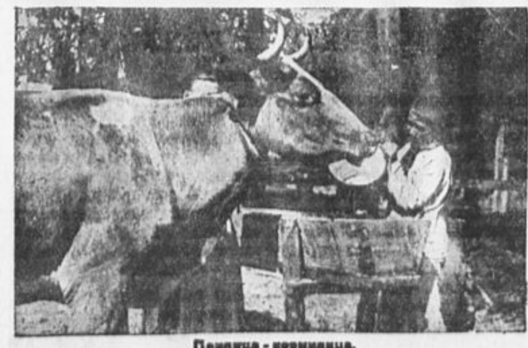
Пешница - кормилица.