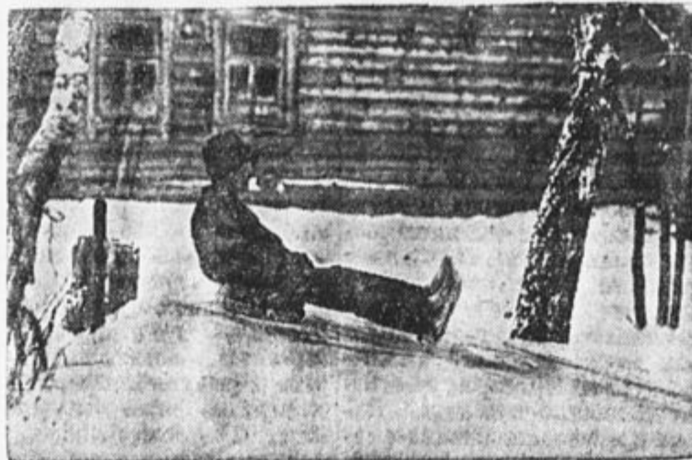
«Голь на выдумки хитра».